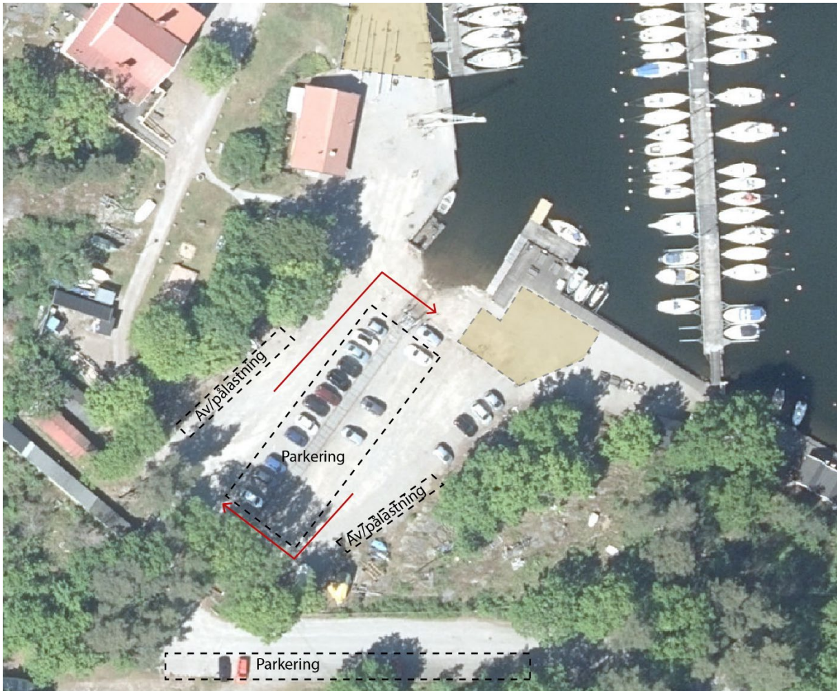
Karta 2. Flöde vis sjösättning av följebåtar