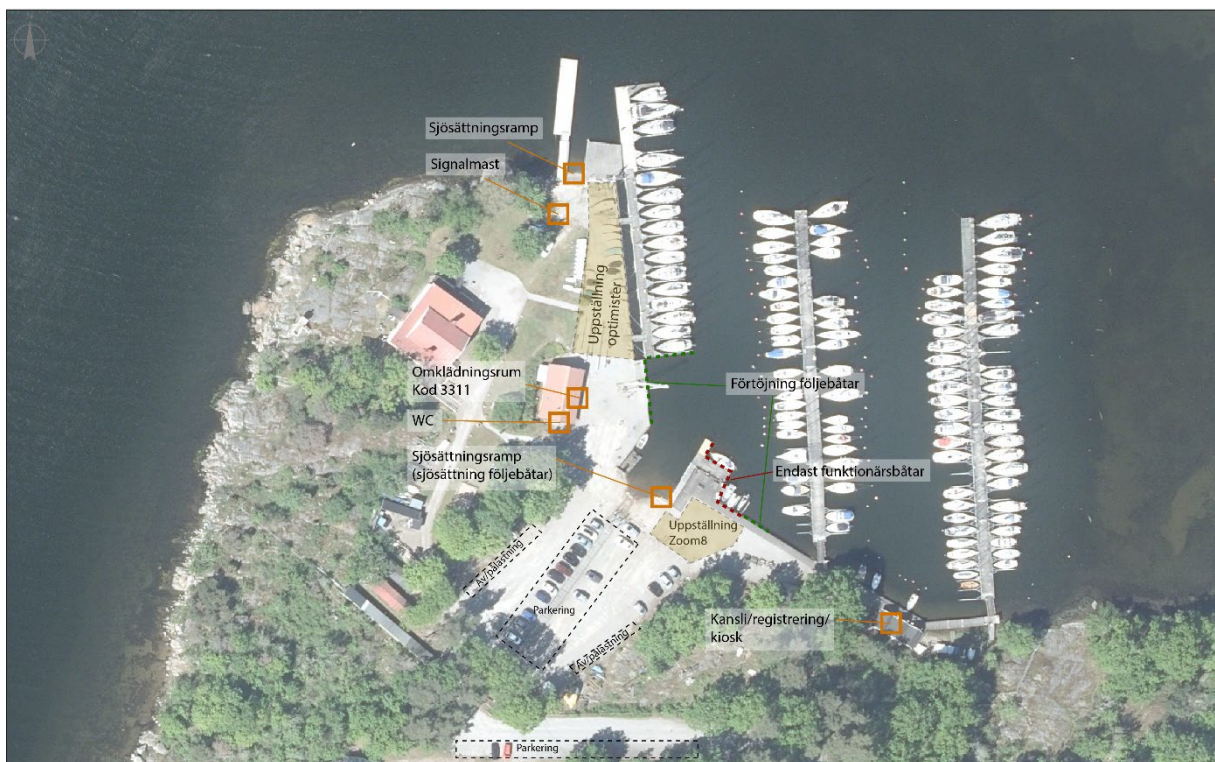
Karta 1. Översiktsbild över området

Trailern parkeras på angiven plats enligt karta 3. Vid trailerparkeringen finns även en större parkeringsplats som kan nyttjas om det är fullt inne på området. Det är fritt att parkera och det är gångavstånd till hamnen.